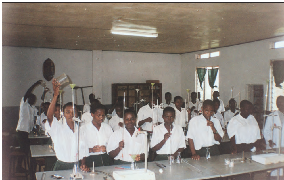
Formazione - Laboratorio di chimica