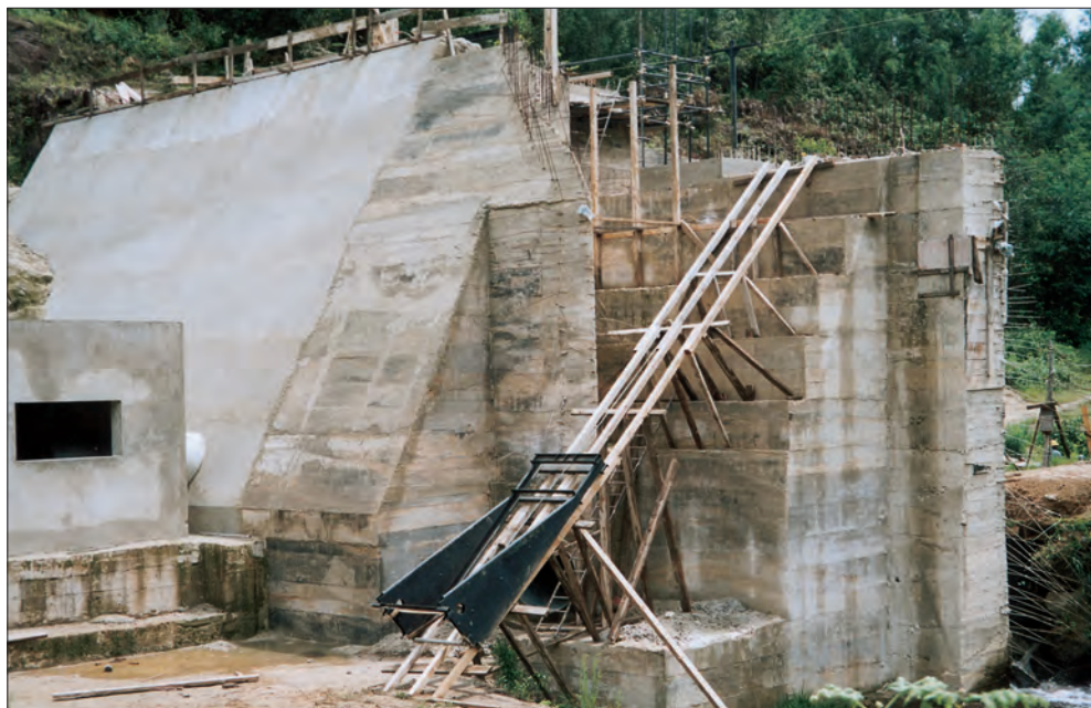
Diga - Avanzamento dei lavori

Il contributo della popolazione locale è molto importante. La gente del posto non deve essere considerata come un semplice recipiente passivo altrimenti, nel tempo, il progetto scomparirà e svanirà nel nulla. Il Centro M. quindi, persegue anche lo scopo di coinvolgere le comunità, affinché si sentano responsabili ed entrino nel progetto, che non sarà